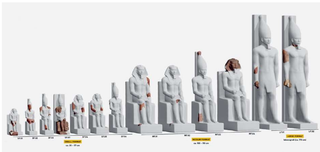
Abb. 1: Aktuelle Übersicht der rekonstruierten Statuen, © SMÄK, Rekonstruktion: Carl Elkins.

Flossmann-Schütze, Mélanie, Forschung im SMÄK. Zerschlagen und Verstreut. Die Statuen von König Radjedef am SMÄK, in: MAAT. Nachrichten aus dem Staatlichen Museum Ägyptischer Kunst München 30, 2024, 10–25.