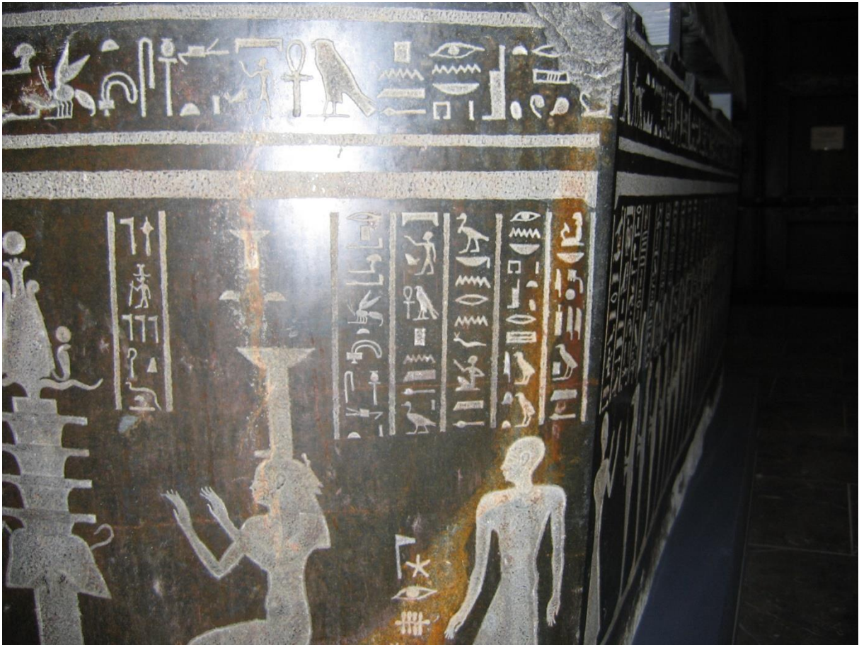
Der Übersichtlichkeit halber noch die Inschrift auf der rechten Seite und der Rest der Kopfzeile