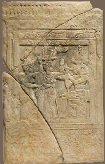
meroitische Stele (Titelmotiv)

Die Vorträge beginnen jeweils um 18:15 Uhr Teilnahme: € 4,- Mitglieder des Freundeskreises frei