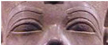
Amenhotep III. (um 1350 v. Chr.)