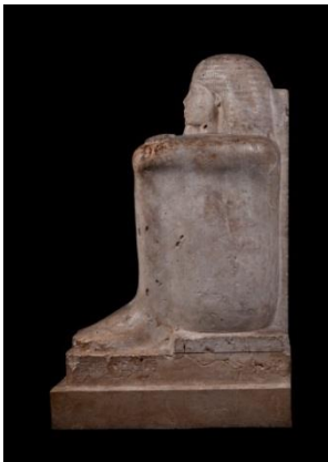
Bekenchons: _____ (hier)

Die ägyptische Kunst hatte ganz spezielle Statuenarten; die ältesten sind sitzende Statuen und die sogenannten Stand-Schreit-Statuen. Ab und zu wurden auch neue Statuentypen entwickelt. Diese hier nennt sich Würfelstatue und kam im Mittleren Reich auf (ab ca. 2000 v. Chr.) Sie zeigt einen hockenden Mann; im Laufe der Zeit verlieren diese Statuen an Details. Kannst Du die Entwicklung dieser Statuenart nachvollziehen, und diese drei Würfelstatuen in der richtigen zeitlichen Reihenfolge einordnen?