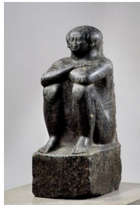
Nesmonth: _____ (Kunst und Zeit)