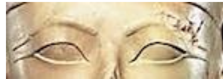
Hatshepsut (um 1470 v. Chr.)

Die Statue wurde also etwa _____ Jahre nach ihrer Entstehung erst beschriftet!