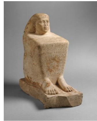
Anchwennefer: _____ (New York)