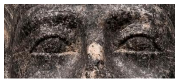
Sesostris III. (um 1950 v. Chr.)