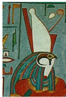
Königskrone von Ober- und Unterägypten

Genauso wie Horus auf verschiedene Arten erscheinen kann (Kind, Falke), so ist nicht unbedingt jeder Gott mit Falkenkopf automatisch Horus. Götter können, abgesehen von ihren Tierformen, auch durch ihre Kronen oder Kopfbedeckungen unterschieden werden. Welcher falkenköpfiger Gott ist welcher? Verbinde sie!